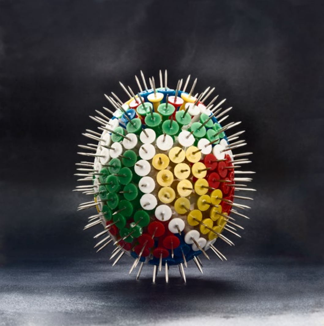
Protective Forms — Pinegg 2019