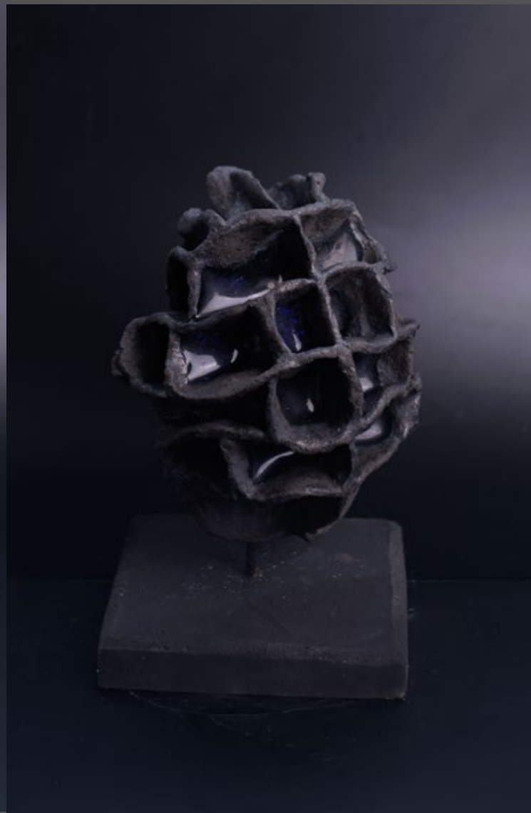
Cellular Structures — ChamberEgg 2024