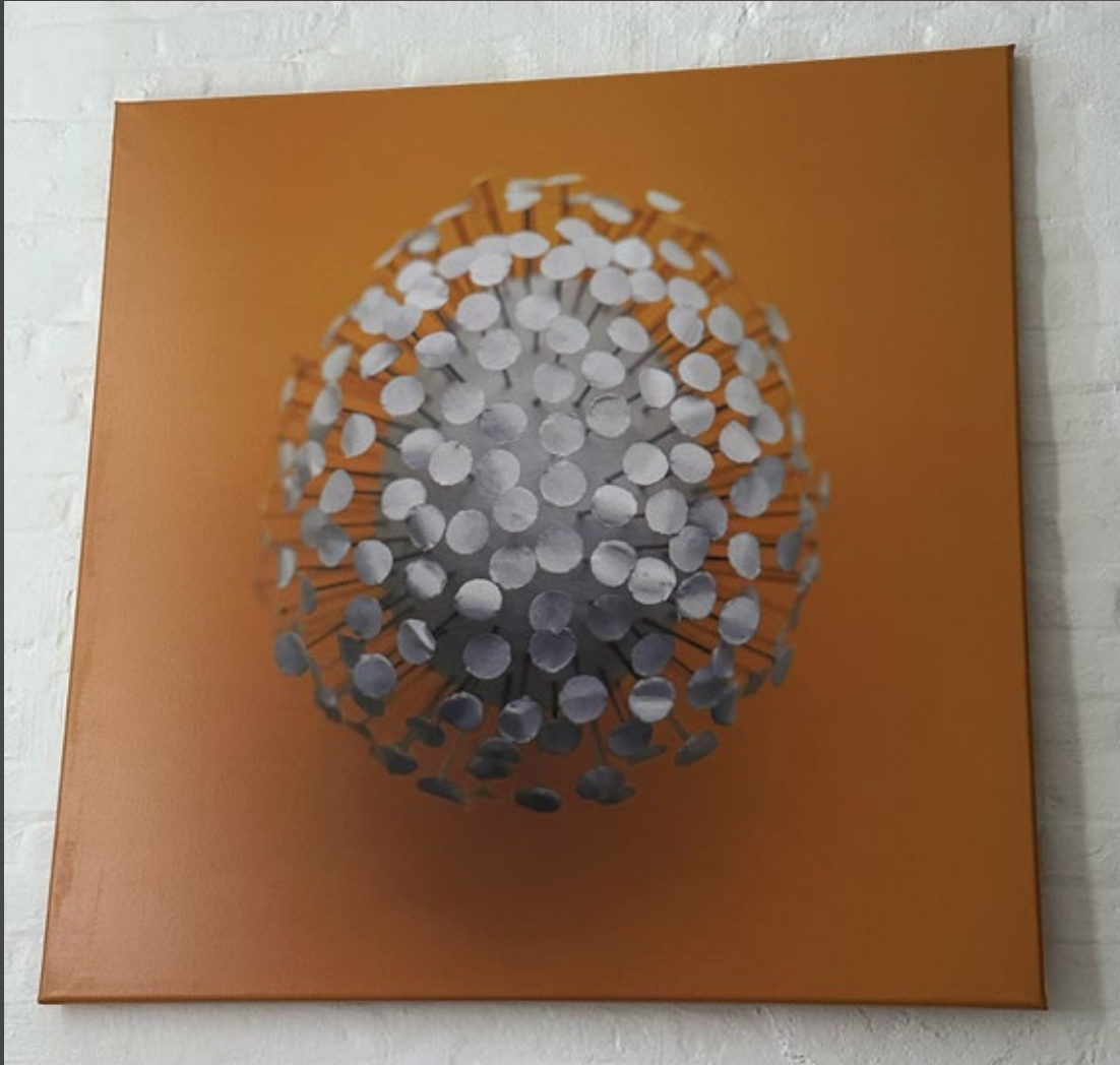
Constructed Surfaces —Dotegg 2017