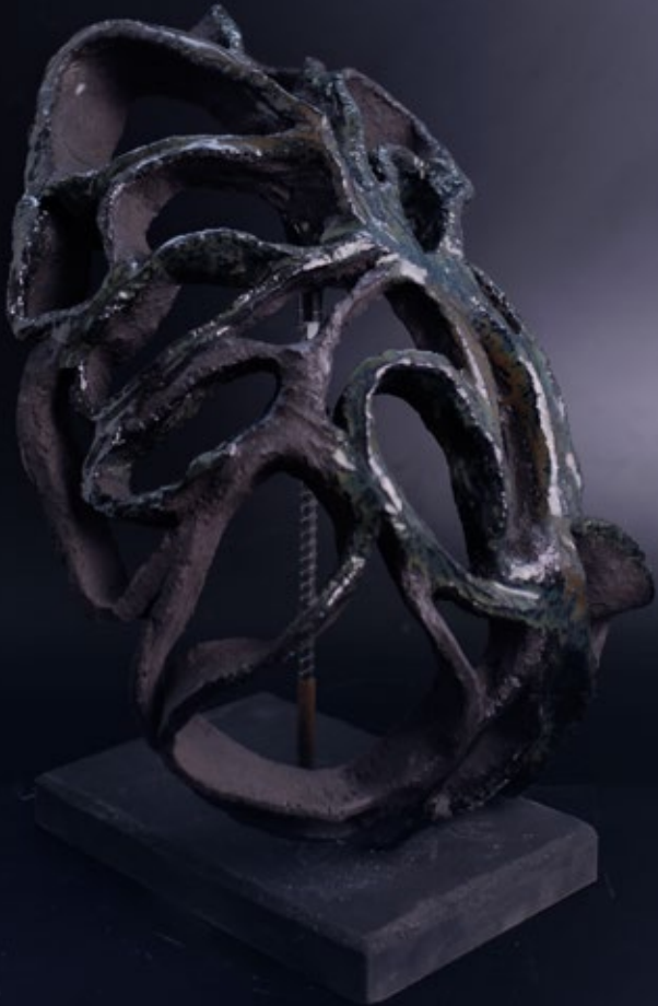
Open Structures — LatticeEgg 2024