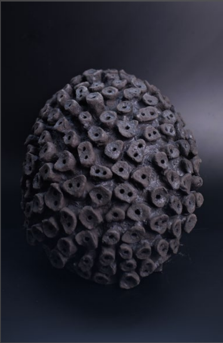
Growth Systems — NodeEgg 2025