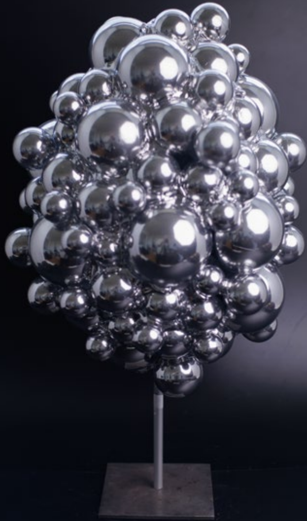
Reflective Structures — MercuryEgg 2026