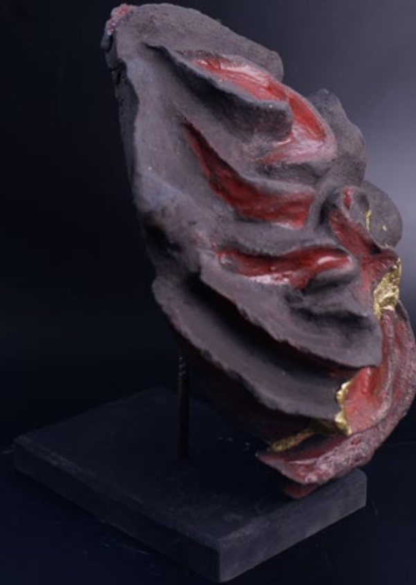
Fractured Forms — VeinEgg 2026